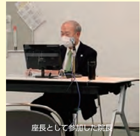
座長として参加した院長